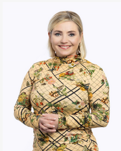
Lilja Alfreðsdóttir Menningar- og viðskiptaráðherra

Ég vil búa menningarlífinu um allt land sterka umgjörð til þess að sækja fram og í menningarsókn þeirri sem kynnt var á haustmánuðum 2021 segir að stuðla skuli að jöfnu aðgengi lista um allt land, fjölbreyttari valkostum fyrir atvinnufólk í listum, fleiri tækifærum til þátttöku í menningarstarfi og ríkari framboði viðburða. Menningarsamningurinn við Akureyri myndar hryggjarstykkið í stuðningi hins opinbera við lista- og menningarlíf Norðlendinga og Uppbyggingarsjóðurinn veitir hinum margvíslegu og áhugaverðu verkefnum brautargengi. Ég óska öllum styrkþegum innilega til hamingju með úthlutunina og Norðlendingum öllum til hamingju með sitt öfluga starf á sviðum menningar, nýsköpunar og umhverfismála.